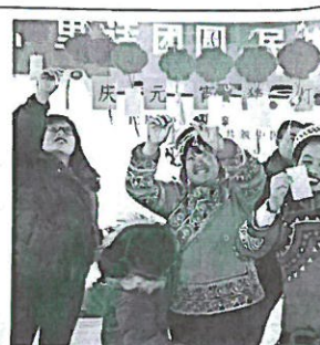
▲ 志愿者们为留守儿童送去温暖和关爱。