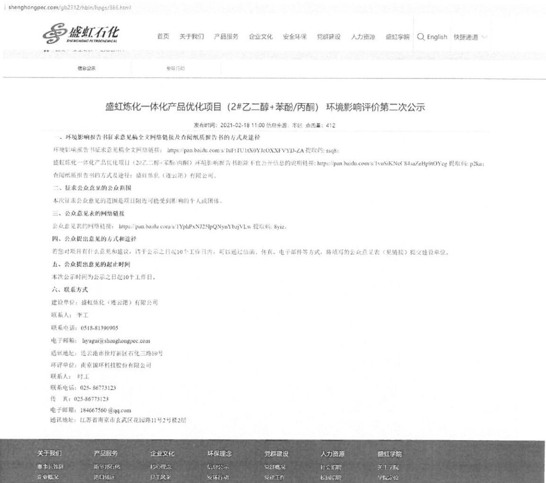
图 3.2-1 第二次网络公示截图