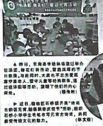
▲ 志愿者们为留守儿童送去温暖和关爱。