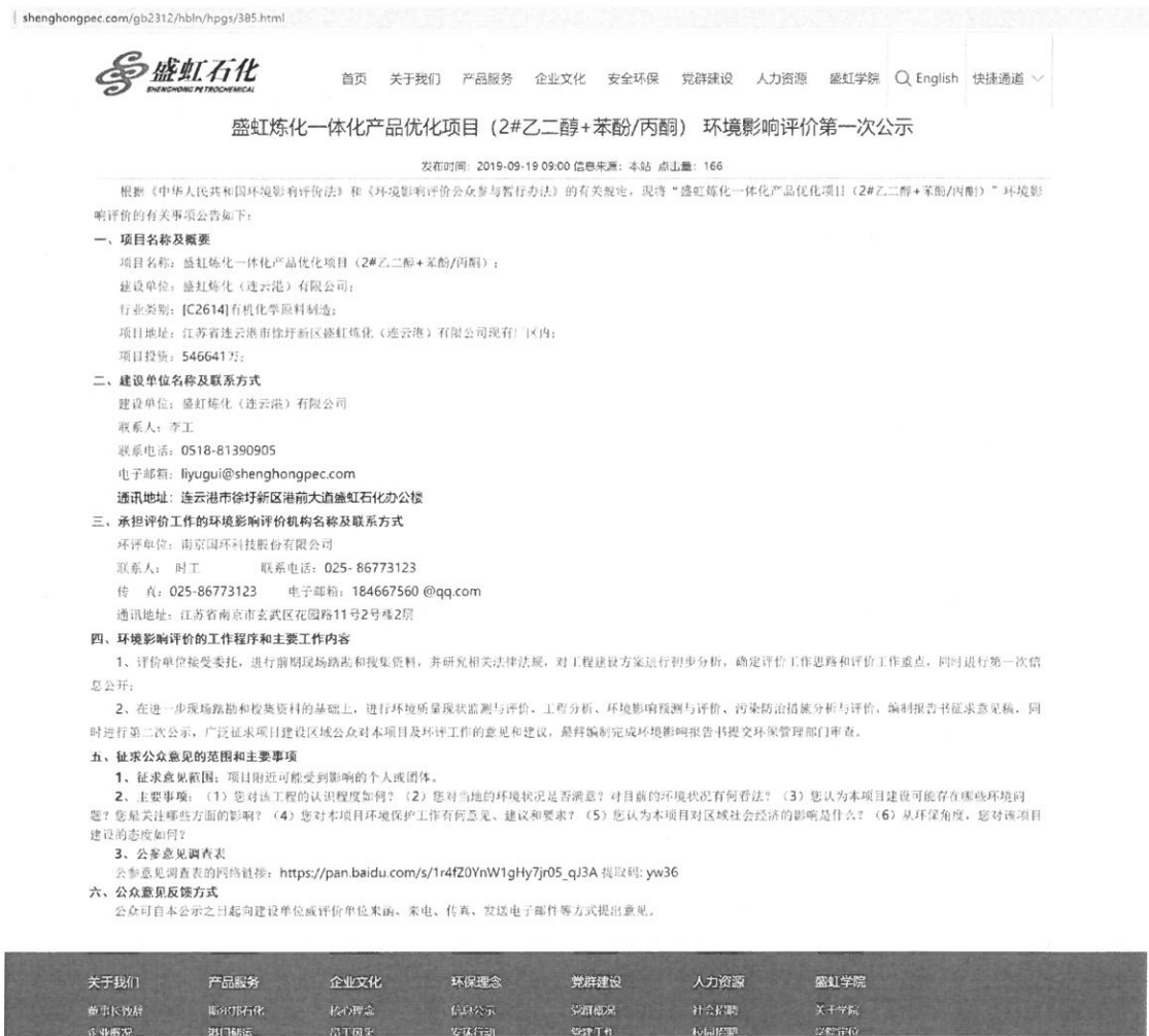
图 2.2-1 第一次网络公示截图

首次环境影响评价信息采用网络公示，公示网站为盛虹石化网站，网站对外公开，因此，本项目首次环境影响评价信息公示选取的网络平台符合相关要求。网络公示时间：2019年9月19日至2019年10月9日，公示网址： http://www.shenghongpec.com/gb2312/hbln/hpgs/385.html ，首次公示网页截图见图2.2-1。