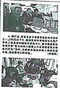
▲ 元宵节，志愿者们为留守儿童送去温暖和关爱。

徐海说，路灯行业的工作，看似简单，实则不然。路灯的维护、检修、更换，都需要高度的责任心和专业的技能。他常说，路灯卫士，守护的是千家万户的安宁。 徐海在路灯行业工作多年，积累了丰富的经验。他常说，路灯卫士，守护的是千家万户的安宁。他常说，路灯卫士，守护的是千家万户的安宁。