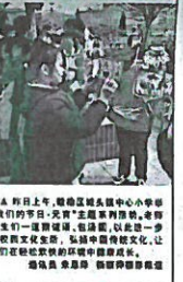
▲ 志愿者们为留守儿童送去温暖和关爱。