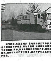
图 3.2-2 报纸公示照片