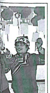
▲ 志愿者们为留守儿童送去温暖和关爱。