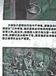
▲ 志愿者们为留守儿童送去温暖和关爱。